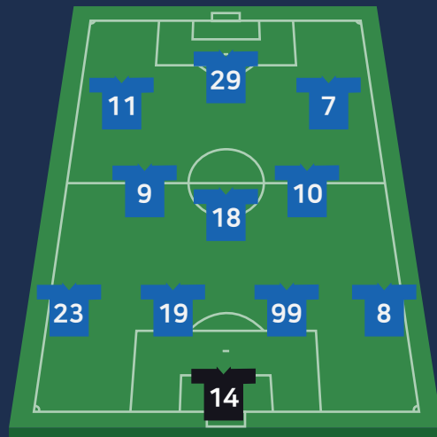
포메이션 (조별예선 1차전)