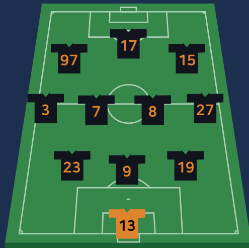
포메이션 (조별예선 2차전)